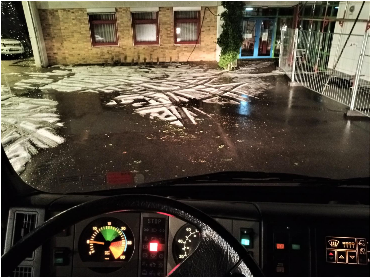
Hagel im Hof der Gögginger Feuerwehr